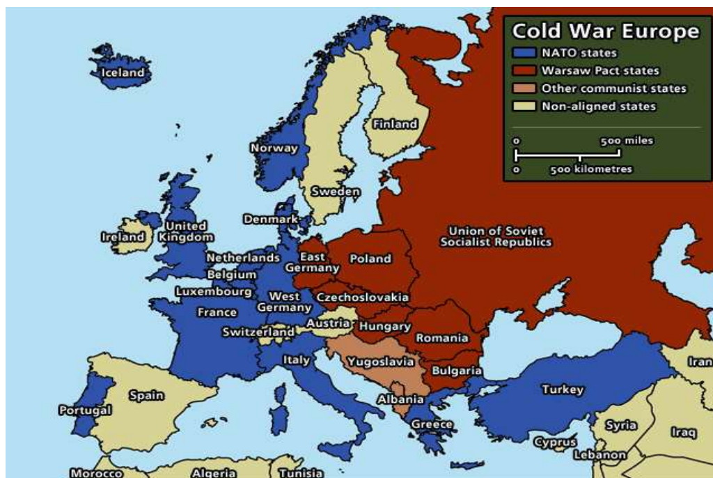
Mapa 2. Hladnoratovska podjela Europe