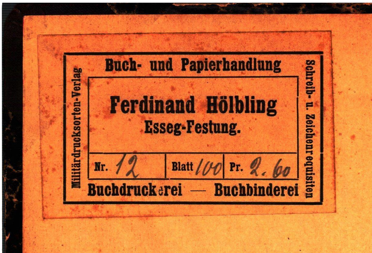
Slika 1. Korice župne spomenice s pečatom Ferdinanda Hölblinga.

olovkom zelene boje, a opisuje bombardiranje Osijeka u vremenu od 22. siječnja do 21. studenog 1944. godine. Na koricama spomenice nalazi se pečat trgovine u kojoj je bilježnica, namijenjena za pisanje spomenice, kupljena. Radi se o trgovini Ferdinanda Hölblinga koja se nalazila u Nutarnjem gradu.