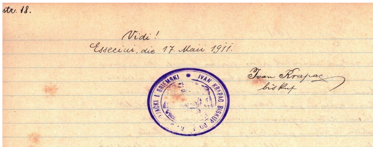
Slika 2. Potpis biskupa Ivana Krapca s pečatom.

Za napomenuti je da fotografije nisu bile sastavnim dijelom ove spomenice, već su, kao što je napomenuto, slučajno pronađene iza ormara 2016. godine. Na kraju 1911. godine, prilikom kanonske vizitacije župi, nalazi se potpis biskupa Ivana Krapca s pečatom.